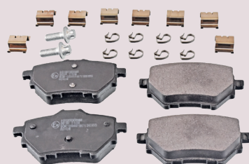
Klocki hamulcowe ( tył )

Zastosowanie: Citroën C4 Picasso, C4 Grand Picasso