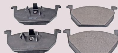
Klocki hamulcowe ( przód )

febi: 16960 OE: 5Q0 698 151 H; 5Q0 698 151 E