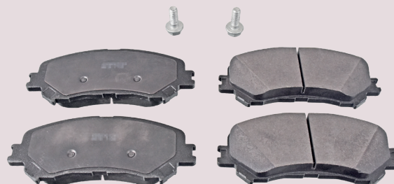
Klocki hamulcowe ( przód )