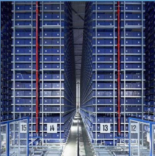
Durch unser hochtechnisiertes Logistikzentrum garantieren wir den schnellen Versand unserer Produkte.