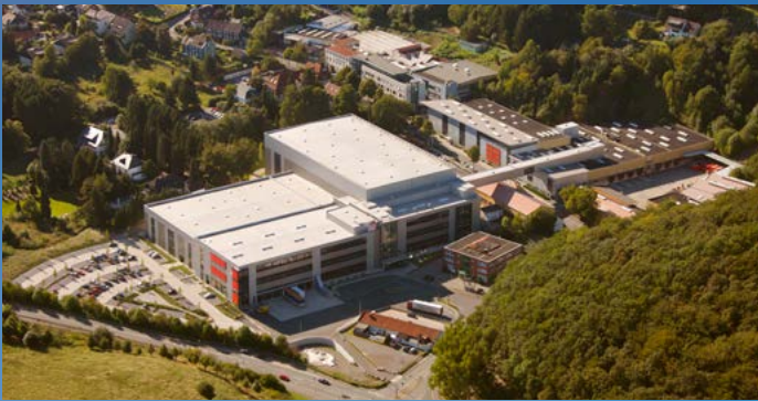
Verwaltung, Eigenfertigung und Logistik am Hauptstandort Ennepetal.

febi bilstein is a leading manufacturer and supplier of car and truck spare parts to the automotive aftermarket. Our extensive product range includes more than 22,000 different spare parts to fit a vast range of cars and trucks. Our international renowned brand represents quality, reliability and swift delivery.