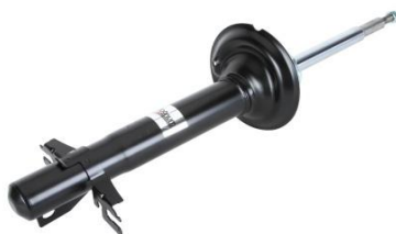
AGP117MT AMORTYZATOR {PRZÓD} GAZOWY

FIAT DUCATO, CITROEN JUMPER, PEUGEOT BOXER 06- 17Q i 20Q