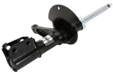
AGY023MT AMORTYZATOR {LEWY, PRZÓD} GAZOWY