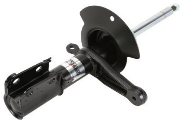
AGY022MT AMORTYZATOR {PRAWY, PRZÓD} GAZOWY