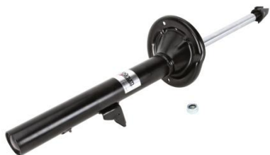
AGY024MT AMORTYZATOR {TYŁ} GAZOWY