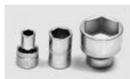
771-LM11 Nasadka 11mm 1/2" HEXAGON

Stara cena: 23,68 zł Cena wyprzedażowa: 9,50 zł