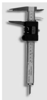
1517-150 Elektroniczna suwmiarka 150mm

Stara cena: 673,34 zł Cena wyprzedażowa: 259,00 zł