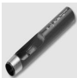
286-15 Wycinak otworów średnica 15mm

Stara cena: 35,26 zł Cena wyprzedażowa: 14,50 zł